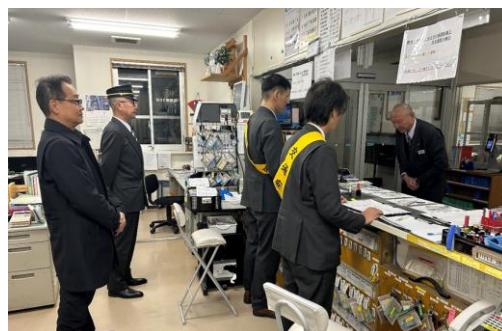
年末年始安全総点検

② 交通安全運動初日及び事故「0」の日（毎月21日）には管理職による早朝点呼立会いや、添乗ならびに主要ロータリー査察を実施しています。