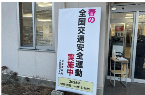
交通安全運動実施期間中（三六看板掲出）

② 交通安全運動初日及び事故「0」の日（毎月21日）には管理職による早朝点呼立会いや、添乗ならびに主要ロータリー査察を実施しています。