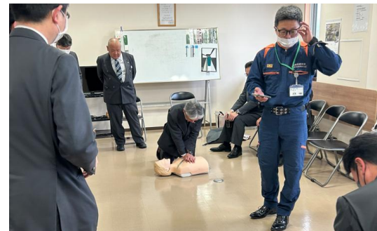
八幡市消防署員によるAED講習