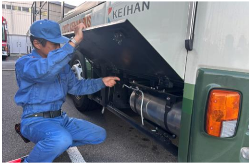
整備員による出庫前点検