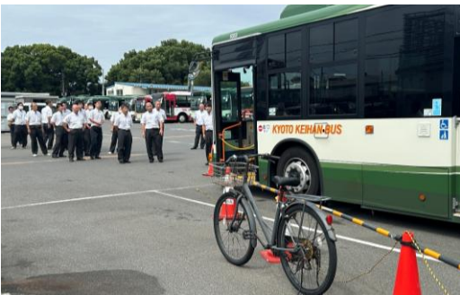
死角（視野範囲）教習