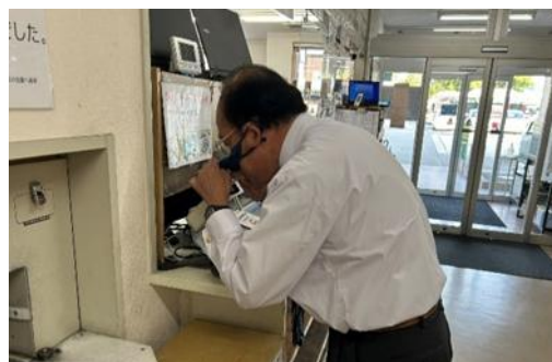
アルコール検知器による飲酒チェック