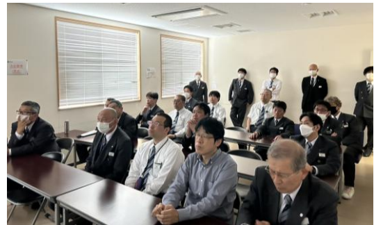
ドライブレコーダーの映像を活用した乗務員研修（事故事例を基に検証）