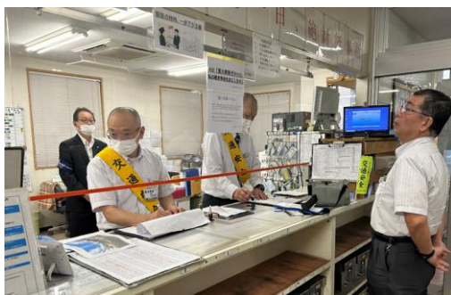
社長巡視（夏の交通事故防止府民運動）