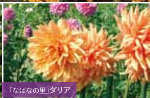
「なばなの里」ダリア