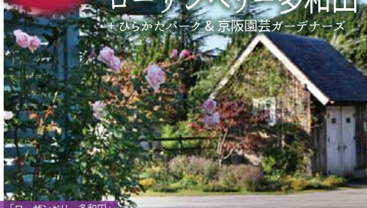
「ローザンベリー多和田」

びわ湖大津館 & ローザンベリー多和田 + ひらかたパーク & 京阪園芸ガーデナーズ