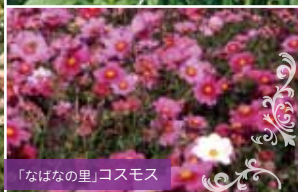
「なばなの里」コスモス